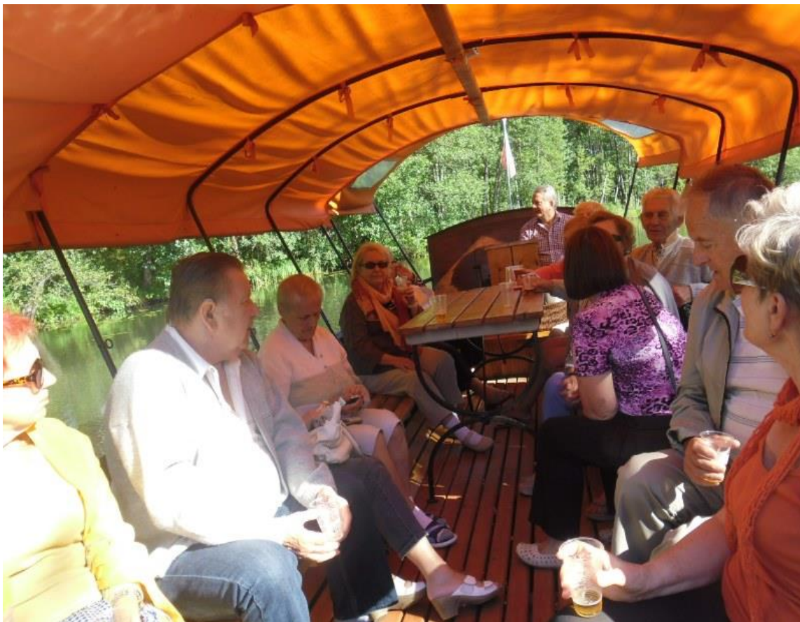
Białoruś – Grodno, Nowogródek, Mir, Kuropaty, Mińsk, Zaosie, Słonim, Synkowicze – czterodniowa wycieczka